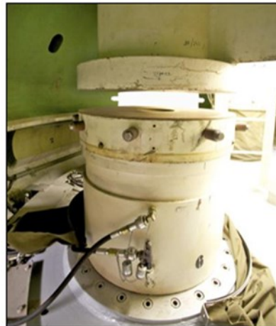
Abbeiding 10 Vijzel ingetrokken (onderschaal op onderstoel)

De Maeslantkering beschikt per zijde over een hydraulische vijzelinstallatie die het bolscharnier van de arm "optillen". De vijzelinstallatie heeft als primaire functie om het bolscharnier gedurende de parkeerstand van de kering op te vijzelen, waardoor slijtage van de glijlak op het bolscharnier en aan de kunststof pads op de concaafdelen wordt voorkomen. Daarnaast moet de vijzelinstallatie in staat zijn om het bolscharnier verder op te vijzelen zodat onderhoudswerkzaamheden aan de glijlak en de pads uitgevoerd kunnen worden. Verder moet de installatie de scharnierconstructie neerlaten voordat het keerproces plaatsvindt zodat het bolscharnier correct positioneerd wordt op de kunststof pads.