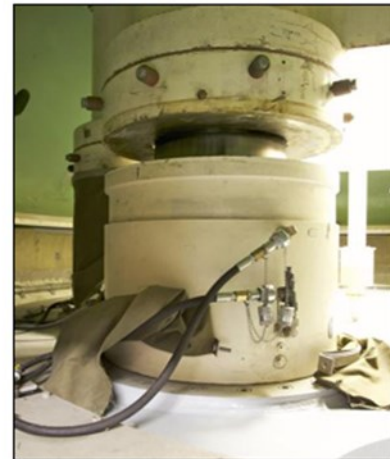
Abbeiding 11 Vijzel in ruststand Kering (15 mm tussen onderschaal en onderstoel)

De vijzelinstallatie bestaat per zijde uit: